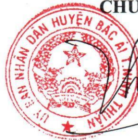
Phan Ninh Thuận